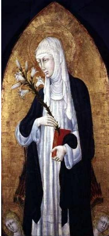
Giovanni di Paolo Hl. Katharina von Siena (Fogg Art Museum, Harvard)

Katharina von Siena, deren Fest wir am 29. April feiern, hatte bereits mit sieben Jahren ihre erste mystische Christusbegegnung. Sie lernte, in das Heiligtum ihres eigenen Inneren zu fliehen, wo niemand sie stören konnte. 1365 trat sie dem Dritten Orden der Dominikaner bei. Sie diente den Armen und Kranken, arbeitete in einer zerstrittenen Welt für den Frieden und wurde allmählich zur einflussreichen Beraterin von weltlichen und kirchlichen Großen. Sie betrieb vor allem die Rückkehr des Papstes aus Avignon (1377) und die innere Reform der Kirche. Ihre Briefe und ihr „Buch von der göttlichen Vorsehung“ (Der Dialog)